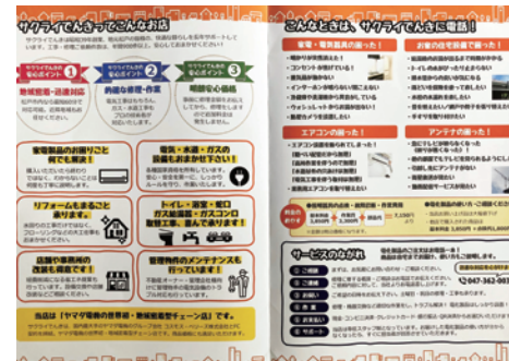
▲店のトリセツも水道・ガス工事力をアピール