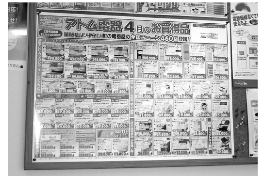
▲アトムチェーンに加盟し価格競争力がアップ

「ウチにとって、新規客獲得の大きなポイントは紹介客を大切にすること。羅針盤の顧客マスターには紹介者を入れる欄があり、店ではこの紹介者をいつもチェックしている。紹介者が新規客の誰を紹介してくれたのか。逆に新規客は誰の紹介で当店のお客になったのか。こうした情報は営業トークにも使えるし、商談に弾みをつける情報にもなる」。