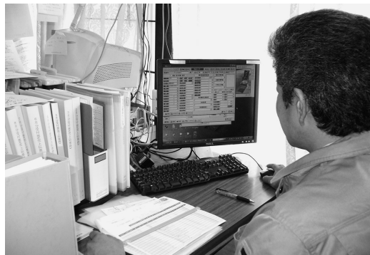
▲顧客情報はすぐ顧客マスターに登録

も、井坂社長は満足している。そのひとつがRFM機能だ。同店ではこの2月に、群馬県電機商業組合主催の「合展」に参加した。